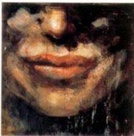
«Liberty 1776: Gillian Anderson», 1996-97. Peinture à la cire / toile. 183 x 183 cm. Wax painting on canvas