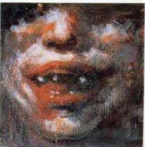
«Liberty 1793: Gillian Anderson», 1996-97. Peinture à la cire / toile. 183 x 183 cm. Wax painting on canvas