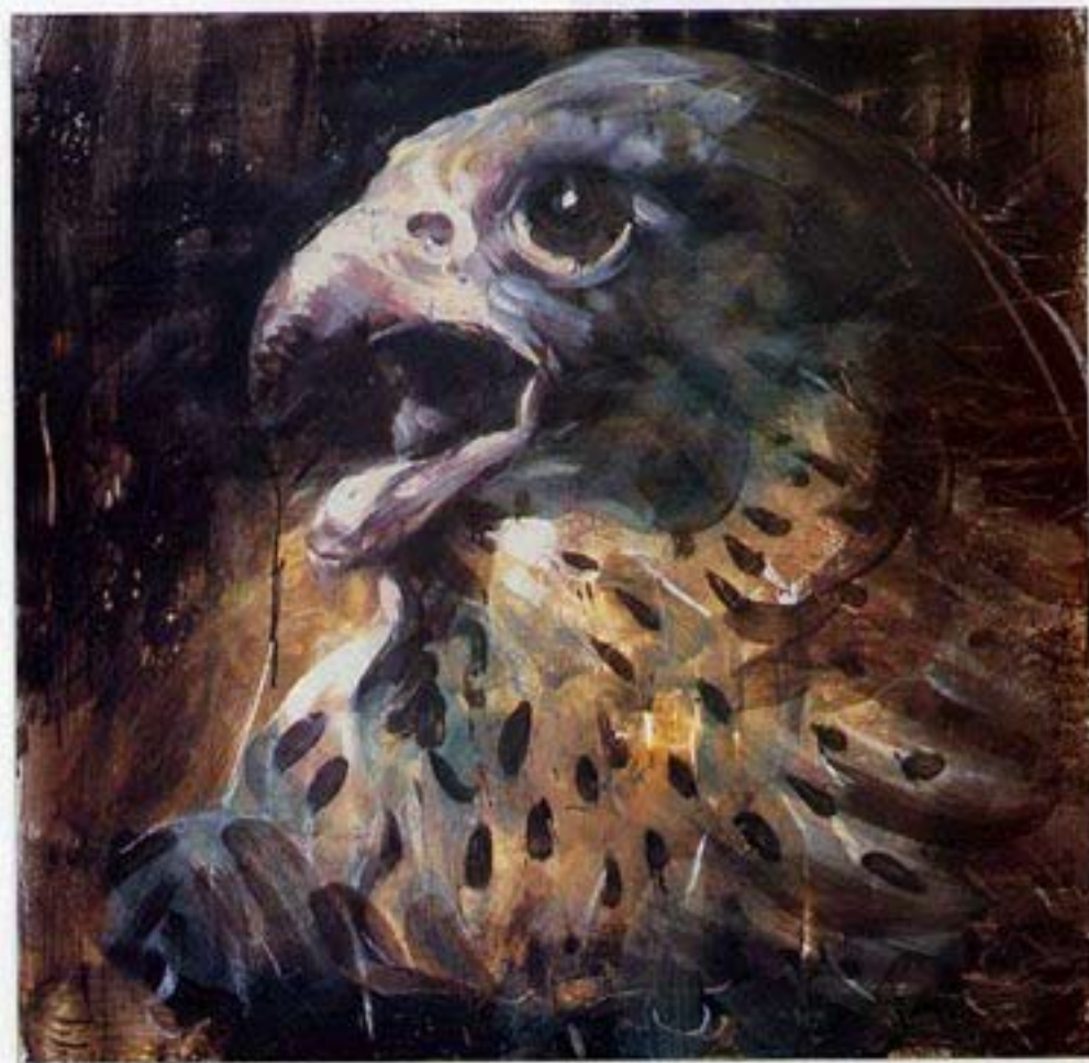
«Marat», 1997. Cire et pigments / toile, 102 x 102 cm. Wax + pigments/canvas.

Still, isn't there a link between wax technique and the themes of your works, and particularly your way of treating mythology and history? Painting abandoned those territories years ago. At school our grandparents learnt Greek and Roman mythology. Our parents less so, ourselves even less. The very little I know I picked up from the movies. I saw Hercules,