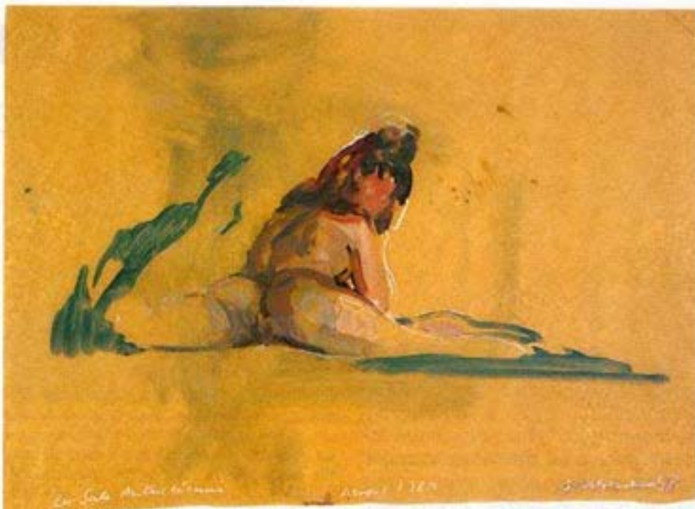
«About 1789 - La sale Aurichienne». 1998. Encaustique, crayon, cire : 85 x 91 cm. "The Dirty Austrian." Encaustic, crayon, brown wax

I read a lot of books about the French Revolution before starting on this work, in order to understand what must have happened in human terms during those years that were decisive for French history and beyond. In an interview at the end of the book