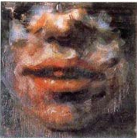
«Liberty 1789: Gillian Anderson», 1996-97. Peinture à la cire / toile. 183 x 183 cm. Wax painting on canvas