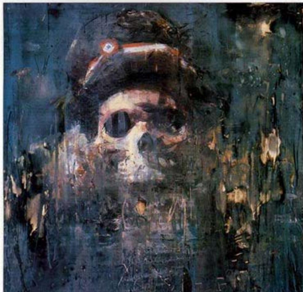
«La liberté 1795», 1995-97. Cire et pigments / toile, 102 x 102 cm, "Freedom 1/95" Wax and pigments/canvas

2000/2001 Exposition itinérante dans divers musées aux USA (accompagnée du livre Chasing Napoleon , textes de Hans Belting, David Moos et Jacques Hériac).